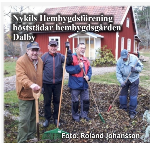
Nykils Hembygdsgårdsförening höststädar hembygdsgården Dalby