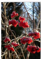
Frostnupna rönnbär i Åby, Norrköping.