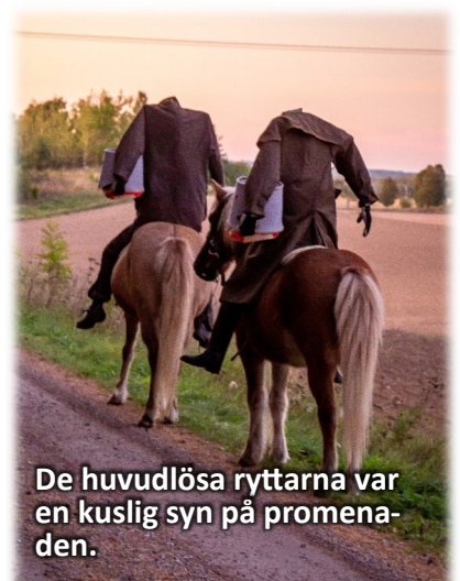
De huvudlösa ryttarna var en kuslig syn på promenaden.

På kyrkogården härjade det vikingar med svärd och sköldar, säckpipa och blås i kohorn ljud över Högby. Så kom det huvud-