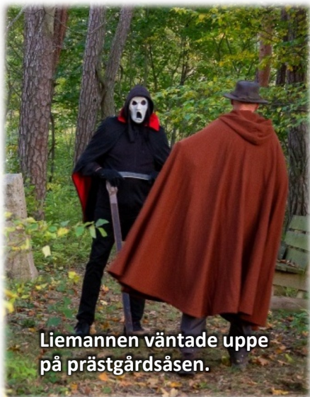
Liemannen väntade uppe på prästgårdsåsen.

lösa ryttare i sakta mak i bakvarv på promenaden. Vägvisare i olika skepnader visade vägen. Uppe på åsen bakom Prästgården stod liemannen med en lie i högsta hugg - av trä, ska tilläggas. Skepnader gjorda av ställningar och