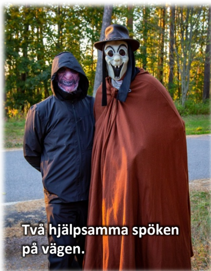
Två hjälpsamma spöken på vägen.