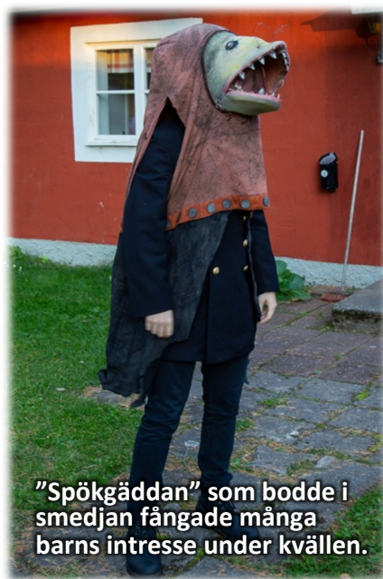
"Spökgäddan" som bodde i smedjan fångade många barns intresse under kvällen.

O m man nu tänker tillbaka vad man kunde gjort bättre är det nog viktigt att ha aktiviteter så barnen inte behöver stå så länge i kö inför vandringen. Nu hade vi ett spöke som bjöd på popcorn, och en del barn smygtittade in i smedjan där gäddan och gästen härjade. Och så kunde man köpa korv och kaffe. Men kön var lång och effekten av vandringen går ju förlorad om man skickar iväg för stora grupper. Så det tål att tänka på inför nästa vandring, när det nu blir någon!