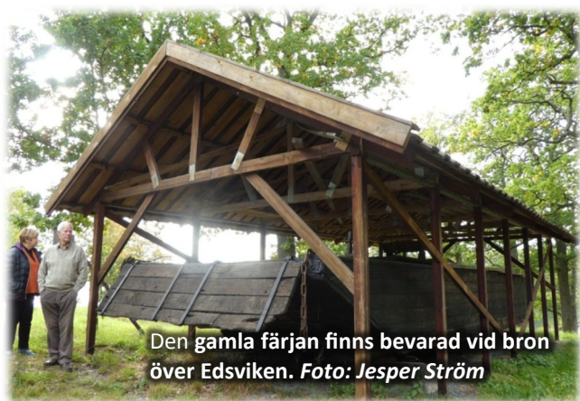
Den gamla färjan finns bevarad vid bron över Edsviken.

Tillsammans med vår vagnpark och övriga äldre inventarier samt kyrkan och den vackra naturen utmed Edsviken kan den utgöra ett intressant turistmål!